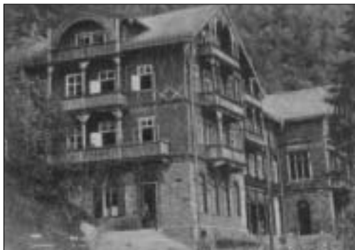
Dom Zdrojowy w Żegiestowie. Pocztówka z końca wieku XIX