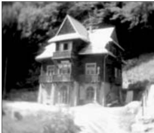
Willa „Orlątko”, do której na krótki okres przeniesiono aptekę po pożarze „Żegotki”. Zdjęcie współczesne