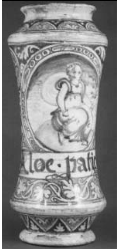
Albarello, majolika, Włochy, XVI w.

Napis apteczny: Aloe patico (Aloe hepatica) - alona wątrobiasta. Jest to sok z liści różnych gatunków aloesów. Środek przeczyszczający.